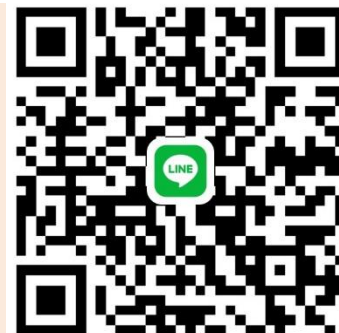
QR code line กลุ่ม OTS99

(ยกเว้น ข้าราชการกลาโหมพลเรือน ชุดปฏิบัติงาน)